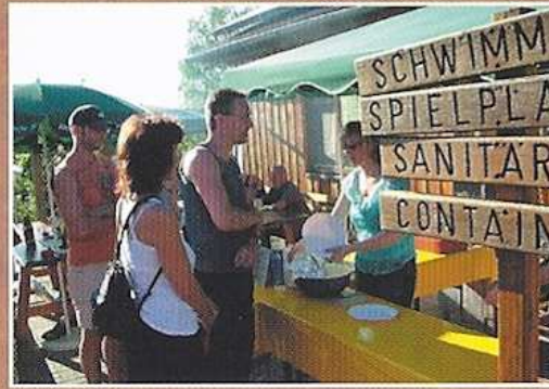
Essensausgabe bei einem unserer Grillfeste ...