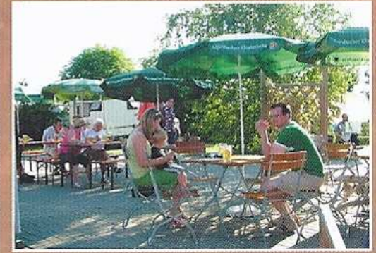
Der Biergarten ...