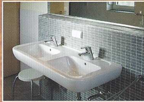
Neben zwei neuen Sanitärgebäuden, stehen Ihnen auch fünf individuell eingerichtete Mietbadezimmer zur Verfügung.