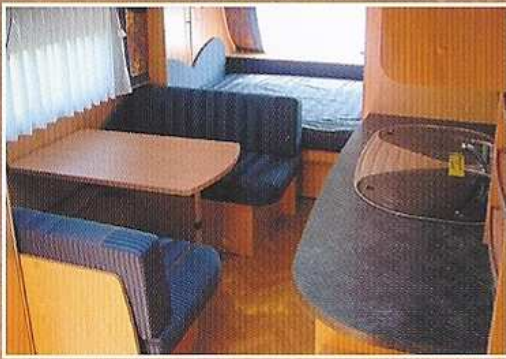
Komfortable Ausstattung unserer Mietwohnwagen ...